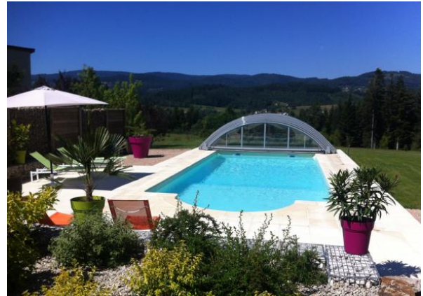
Télescopique et sans rail au sol, cet abri bas sait se faire discret pour profiter de la piscine en toute liberté.