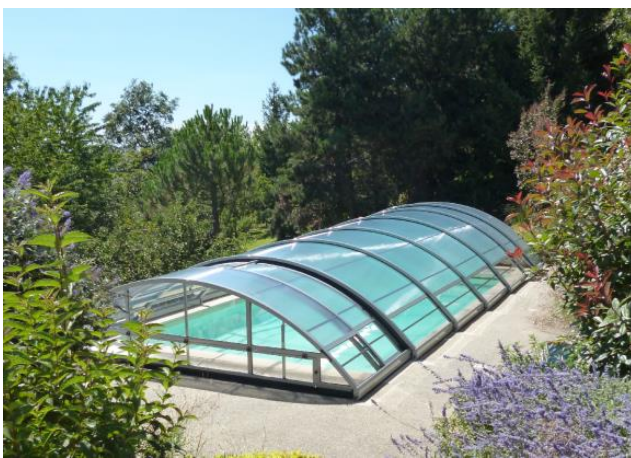
L'abri bas, l'habillage idéal pour cette piscine cachée dans son écrin de feuillage

Compacts et d'un faible encombrement, les abris bas sont une protection efficace contre le vent et même le mauvais temps. Leur mécanisme télescopique sans rail au sol en fait un système pratique et simple à poser. Côté confort, l'effet de serre augmente la température sous l'abri de 8 à 10 °C.