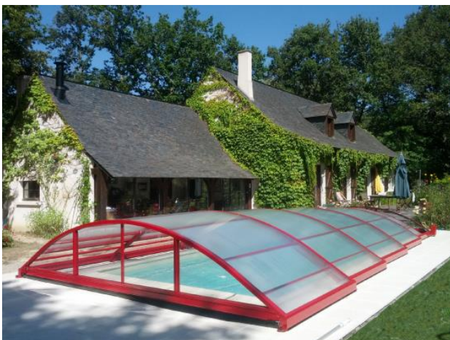
Subtile harmonie des matériaux et des couleurs entre cette maison de campagne et son abri bas